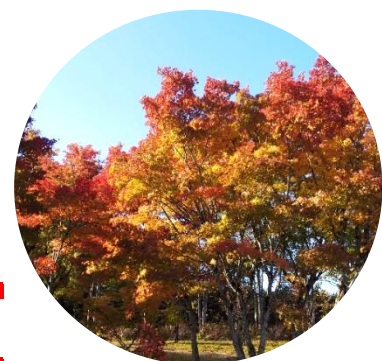
Momiji Forest, Other Places in the Park (Autumn Leaves) Oct