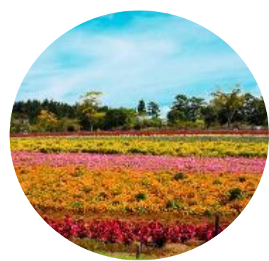
Rainbow Flower Garden Mid Sep – Mid Oct

จากนั้นนำท่านเดินทางสู่ สวนดอกไม้บีกกะโนะซาโตะ ให้ท่านได้นั่งรถรางสัมผัสบรรยากาศภายในไร่ ชมความสวยงามของดอกไม้ นานาพันธุ์ อาทิ ดอกกุหลาบ, ลิลลี่, ซาเวียร์, ดอกเวอร์จิเนีย และดอกโคเคีย หรือโคชิอะ ที่แบ่งบานต้อนรับผู้ที่มาเยือน เก็บภาพประทับใจ ที่แสนโรแมนติกกับมวลหมู่ดอกไม้หลากสีสันจากหลังยังเป็นโบสถ์สุดคลาสสิก ซึ่งภายในสวนบีกกะโนะซาโตะแห่งนี้เปิดให้เข้าชมทุกฤดูกาล ซึ่งฤดูร้อนช่วงปลายเดือนเมษายนเป็นต้นไปจนถึงเดือนพฤษภาคมจะเป็นทุ่งดอกพังกัมอส และสวนดอกไม้ลิป มากมายหลากหลายสายพันธุ์ให้ทุกท่านได้เลือกชม นอกจากนี้พาร์คแห่งนี้จะเป็สวนดอกไม้แล้วนั้น ยังมีโซนอื่นๆให้ท่านได้เลือกชมอีกด้วยไม่ว่าจะเป็นสวนสัตว์ กิจกรรมเวิร์คช็อป และคาเฟ่ ร้านน่ารักๆต่างๆมากมายให้ท่านได้เลือกตามอัธยาศัย หมายเหตุ : รายการท่องเที่ยวนี้รวมค่าเข้าชมสวน แต่รวมค่าบริการรถราง ภายในสวนและดอกไม้ที่จัดแสดงจะเปลี่ยนแปลงตามฤดูกาล