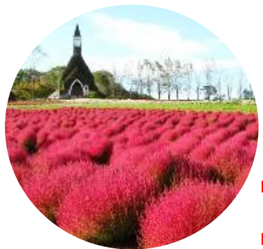
Crocia flower Late of Sep – Mid Oct