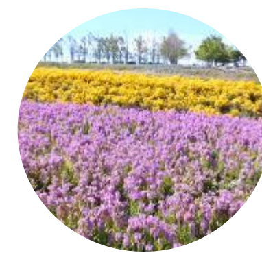
Aurora flower Graden (Golden Pyramid, Fisostegia) Late of Sep – Early Oct